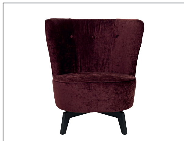
Carmen, wersja obrotowa