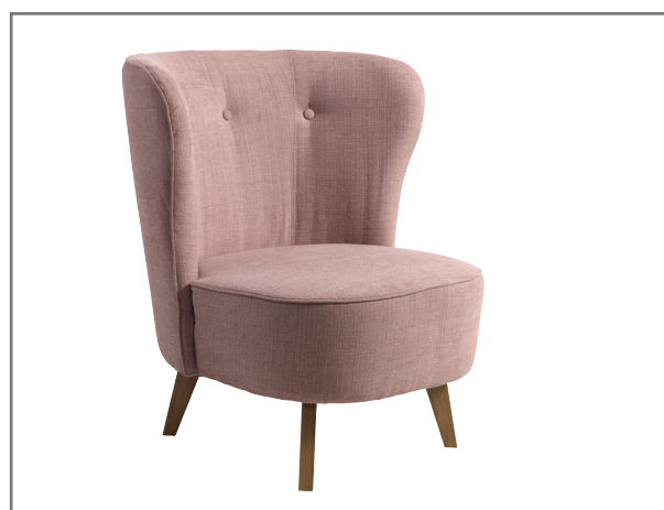
Carmen; wersja podstawowa; nóżki drewniane CARMEN

Fotel typu Carmen, to fotel-kameleon, można by rzec. Wszystko za sprawą tapicerki, która w zależności od barwy i struktury, zgrabnie dostosowuje się do charakteru otoczenia. Kształt fotela z kolei, odznaczający się miękką, łagodną w zagięciach linią, skutecznie zachęci do zatopienia się w nim i odpłynięcia w krainę błogiego relaksu.