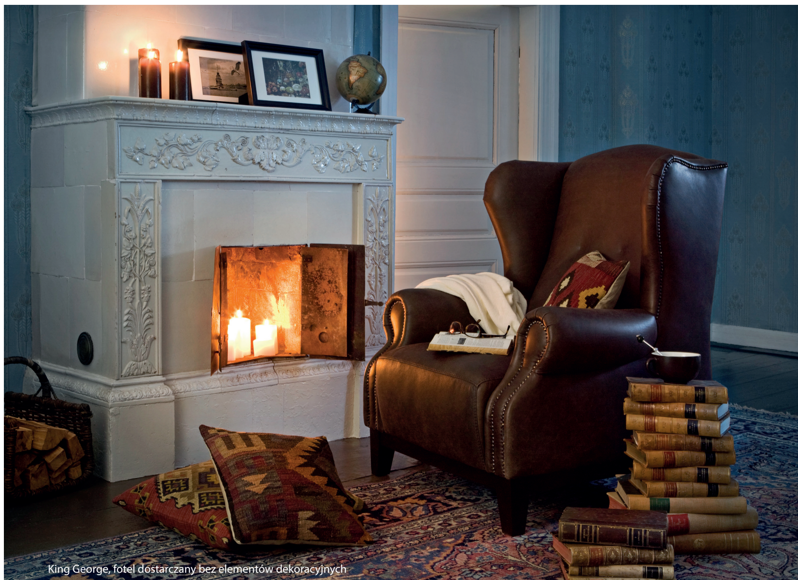
King George, fotel dostarczany bez elementów dekoracyjnych