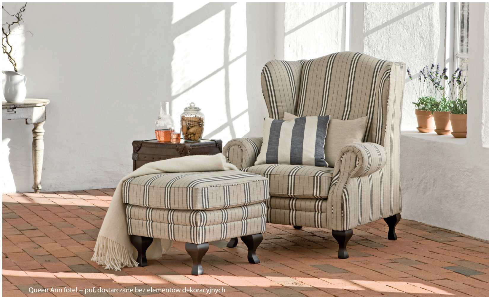
Queen Ann fotel + puf, dostarczane bez elementów dekoracyjnych