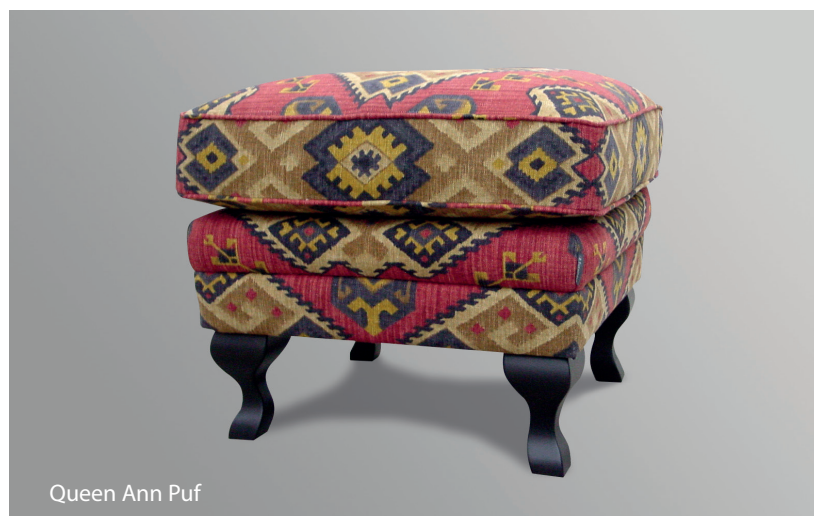
Queen Ann Puf