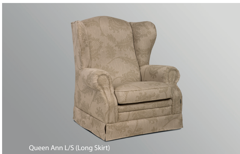
Queen Ann L/S (Long Skirt)